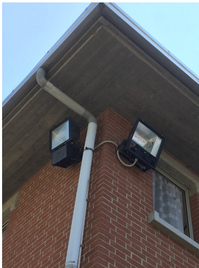
Particolare della gronda