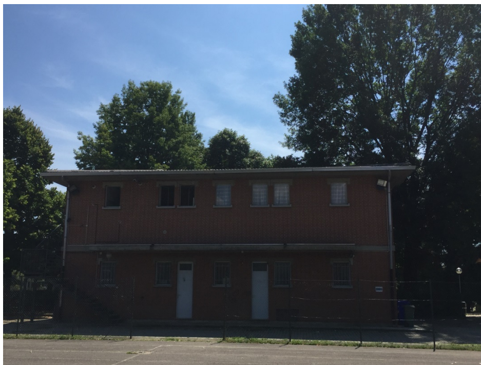
Prospetto nord ovest