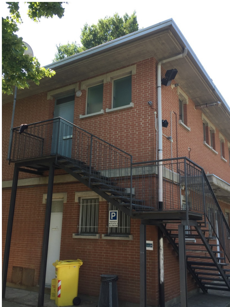
Particolare scala di sicurezza