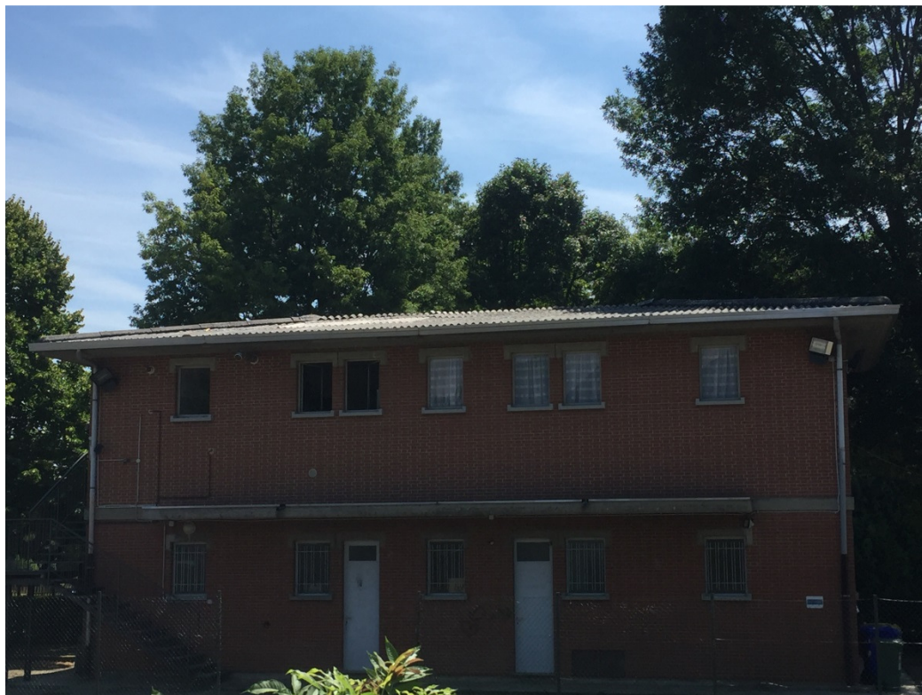
Vista dell'edificio in oggetto