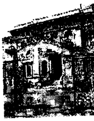
La casa di riposo

REDAZIONE VIA XXV FEBBRAIO 17 BIELLA 11900 TELEFONO 015 8332633 FAX 015 2232929 E-MAIL BIELLA@ESTATONLINE.IT WEB WWW.LASTAMPA.BIELLA.IT PUBBLICITÀ FURBILUMINISS S.P.A. BIELLA - VIA CROCEVERDE 4 TELEFONO 015 2522111 - 015 8304508 FAX 015 2227930