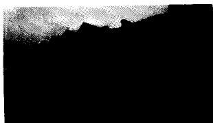
18/07/2014 Case popolari, addio all'obbligo della residenza da almeno otto anni