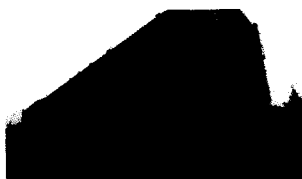
11/10/2014 Ville, box e alloggi all'asta Ecco le proprietà del Comune