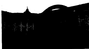
04/12/2014 Boom di aste immobiliari: "Ma con la nuova legge si può bloccare la vendita"