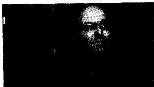
16/01/2015 Porgi l'altra nocca MASSIMO GRAMELLINI