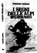
I Segni Delle Alpi