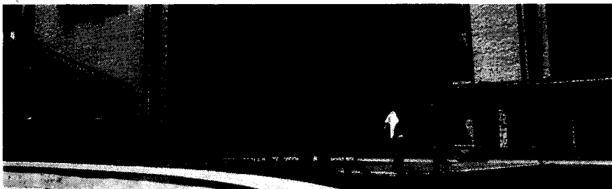
Le case Arer al Quartiere Dora nel capoluogo regionale