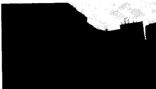
11/08/2013 La Provincia mette in vendita l'ex caserma dei vigili del fuoco