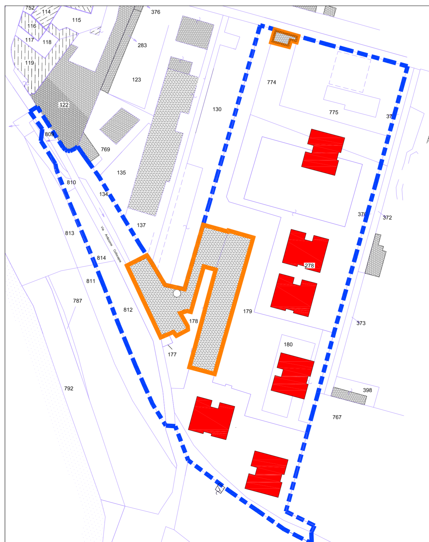
IL PROGETTO IN VARIANTE INSERITO NELL'ESTRATTO DI MAPPA - FOGLIO 81 - SCALA 1:1000